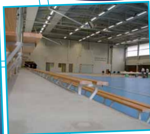
PISCINE, SALLE DE MUSCULATION ET GYMNASSE DANS L'ENCEINTE DU LYCÉE