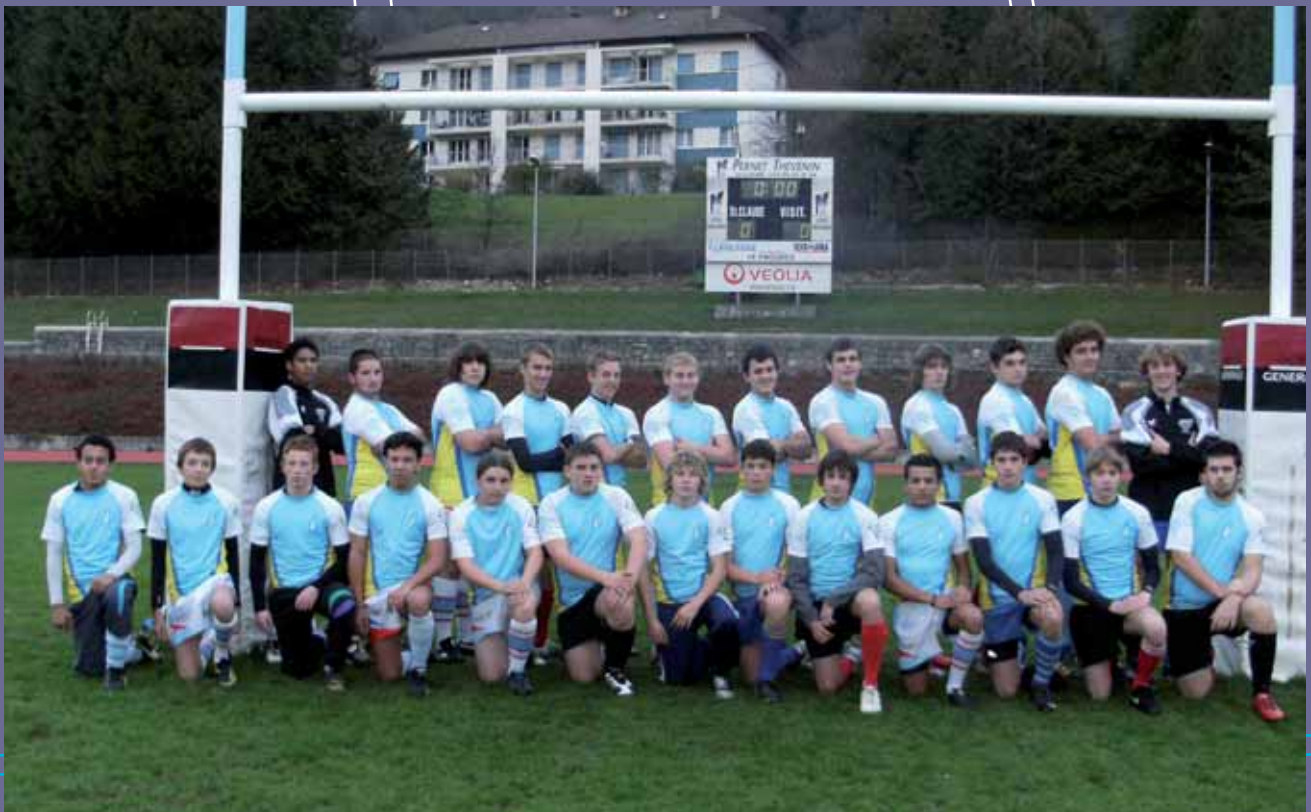
ÉQUIPE SECTION LYCÉE 2009-2010