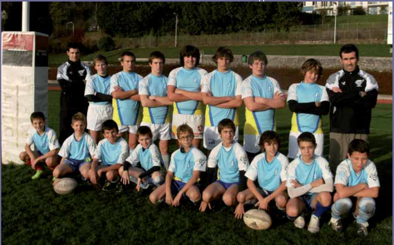
ÉQUIPE SECTION COLLÈGE 2009-2010